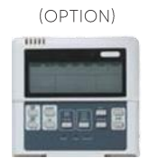
Panou de comandă cu fir KJR12B