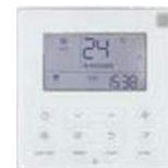
Panou de comandă cu fir KJR-120X2